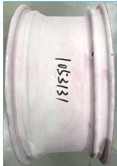
圈数: 95,000 照片 3