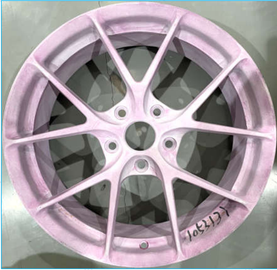
圈数: 95,000 照片 1

客户: 宁波铭匠智能设备有限责任公司 史密斯编号: 1053131 报价单号: W22858AJ+W22902JW 客户工作描述: 车轮动态弯曲疲劳测试 客户零件编号: 未标识