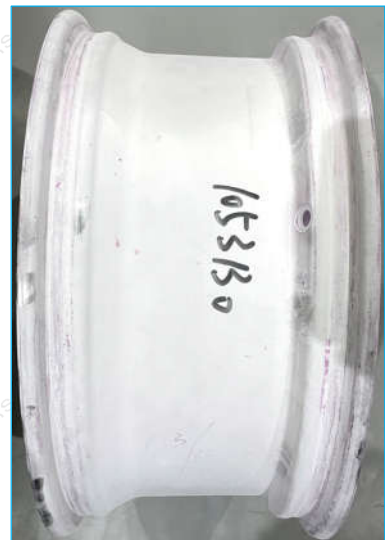
圈数: 1,850,000 照片 3