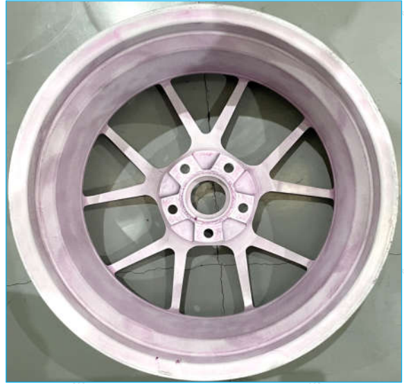
圈数: 95,000 照片 2