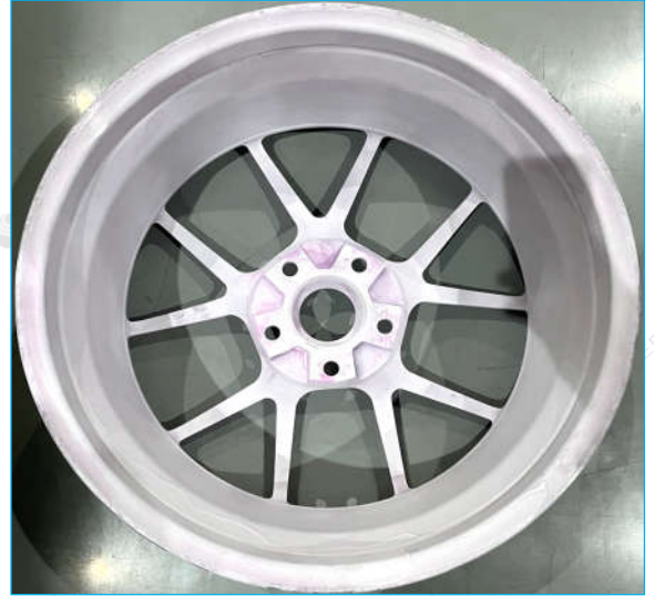
圈数: 1,850,000 照片 2