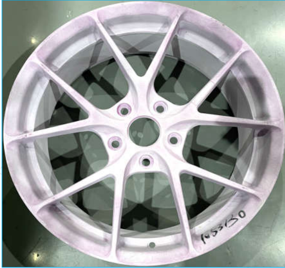
圈数: 1,850,000 照片 1

客户: 宁波铭匠智能设备有限责任公司 史密斯编号: 1053130 报价单号: W22858AJ+W22902JW 客户工作描述: 车轮动态径向疲劳测试 客户零件编号: 未标识